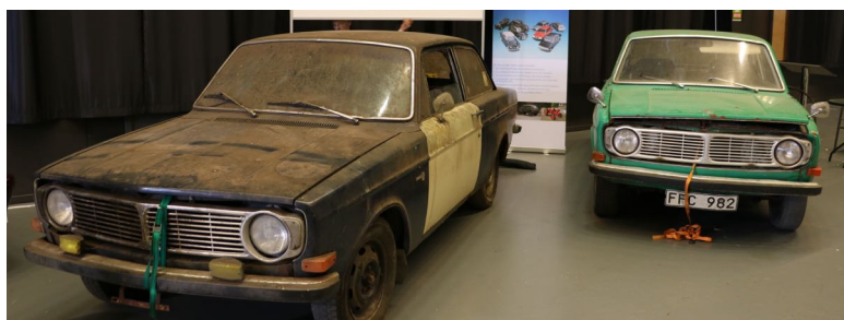
Till vänster i bild: Volvo 142, T4. Till höger i bild: Volvo 142, T1

Det var helt fantastisk hur mycket folk som kom in i montern och ville diskutera bevara eller renovera. Porsche-montern snett emot drog däremot mycket färre besökare.