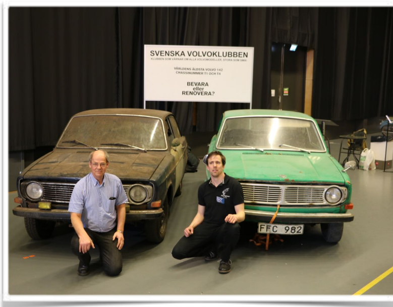
Två av världens äldsta hittills okända bevarade 142 förseriebilar och dess lyckliga ägare.